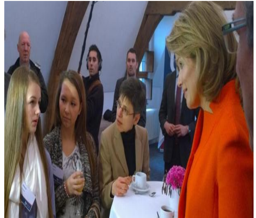
Pesten dit kan niet prijs 2016 en een betrokken koningin Mathilde op een studiedag.