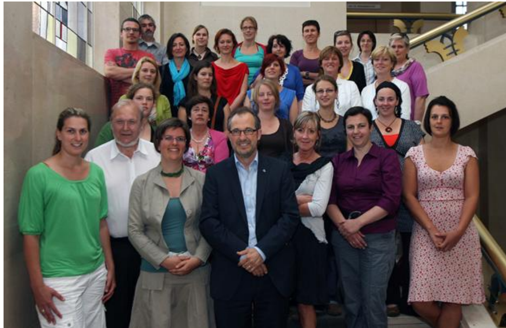
28 opgeleide HERGO-moderatoren actief op school, CLB en Arktos sinds 2010

De herstelblik leeft in Turnhoutse scholen. HERGO op school, geweldloze communicatie, verbindende initiatieven. Een zicht op proactieve cirkels